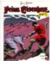
Der Heilige Gral