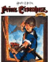
Sim, Sohn von Eisenhut