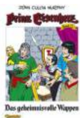
Das geheimnisvolle Wappen