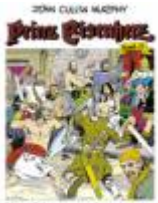
Der Plan des Horribus