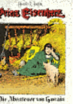
Die Abenteurer von Gwalda