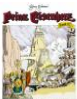
Die Prinzessin von Saba