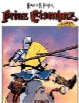
Ein Zwerger für Klein