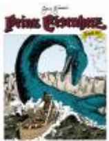
Der Drache des Pilten