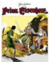
König Salomos Gold