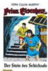
Der Stein des Schicksals