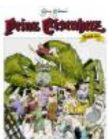
Das Meer der Ungeheuer