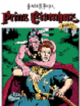
Der Sohn der Sommerkönigin