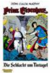
Die Schlacht am Tintagel