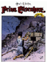
Das Schwert des alten Yngve