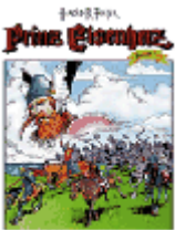
Die Schlacht von Jochen Hill