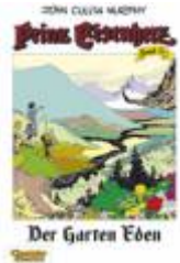
Der Garten Eden