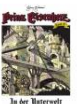
In der Unterwelt