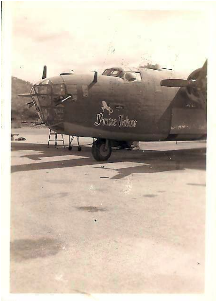
1944 KING FEATURES Prinz Valiant Syroco Figur (USA)

Die Homepage 380th.org listet alle Flugzeuge des Geschwaders auf - und so fand ich diesen Link zu diesem Bomber - und dort dann folgendes Photo: