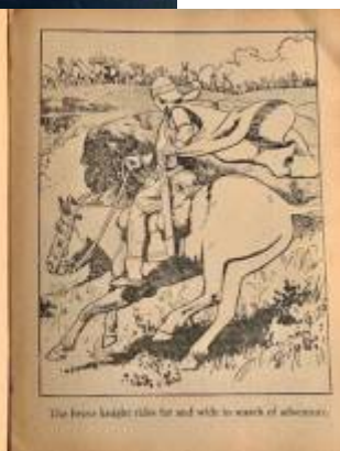
The brave knight rides far and wide in search of adventures.