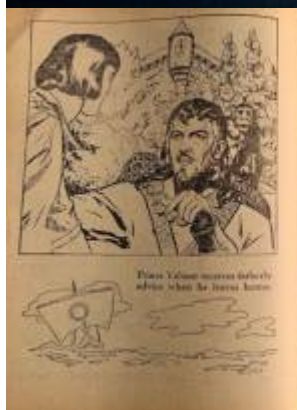
Prince Valiant receives a letter which he leaves behind.