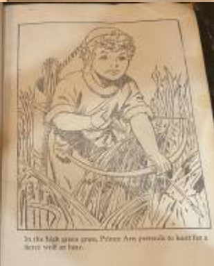
In the high grassy plain, Prince Arty pretends to hunt for a better world to come.