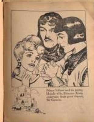
Prince Valiant and his party, headed with Prince Arthur, conquer their good friend, Sir Grimsby.