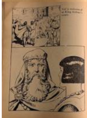
King Arthur is welcomed at King Arthur's court.