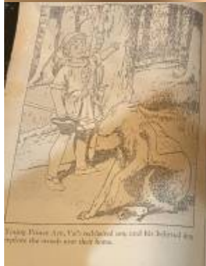
Young Prince Arty, the noblest son, and his beloved dog explore the woods near their home.