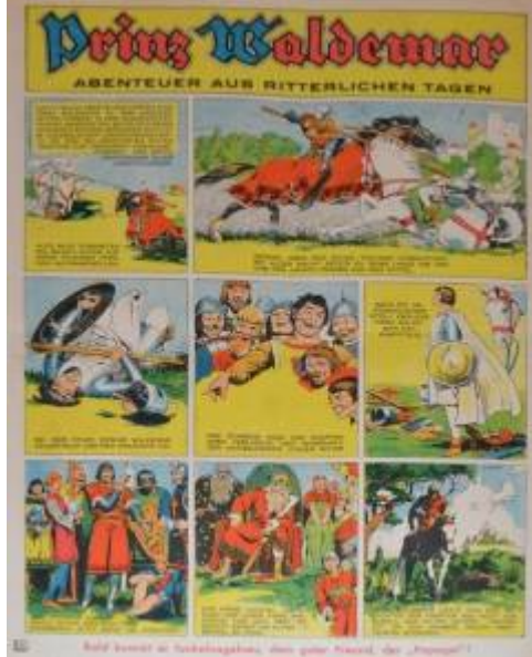
Heil kommt in Tadelsgabe, dem ganz Kaiser der „Prinzen“!