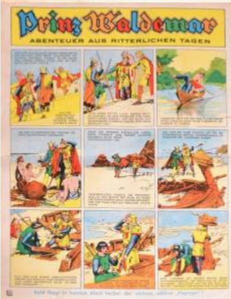
Soll Regel in seinem Reich helfen die vielen, vielen Jünglinge!