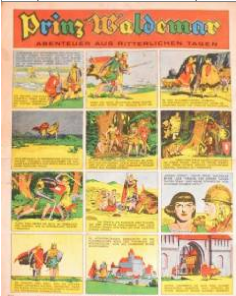
Das nächste Heft wird veröffentlicht, da wir es ja bald selber sehen!