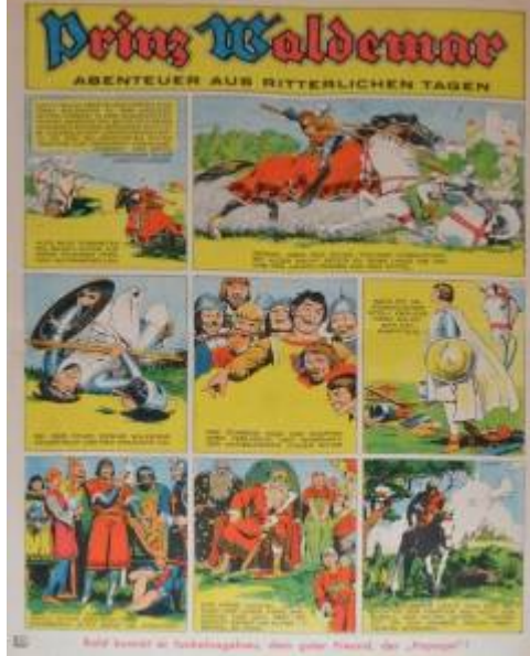
Kein Heerlein in Tadelngebahn, dem ganz Kaiser der „Prinzen“!