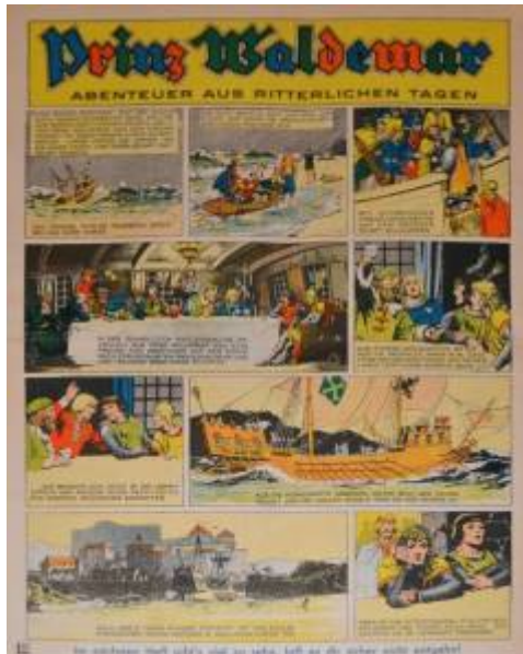
Im nächsten Heft geht's mit so sehr, laßt es die vorher nicht entgehen!