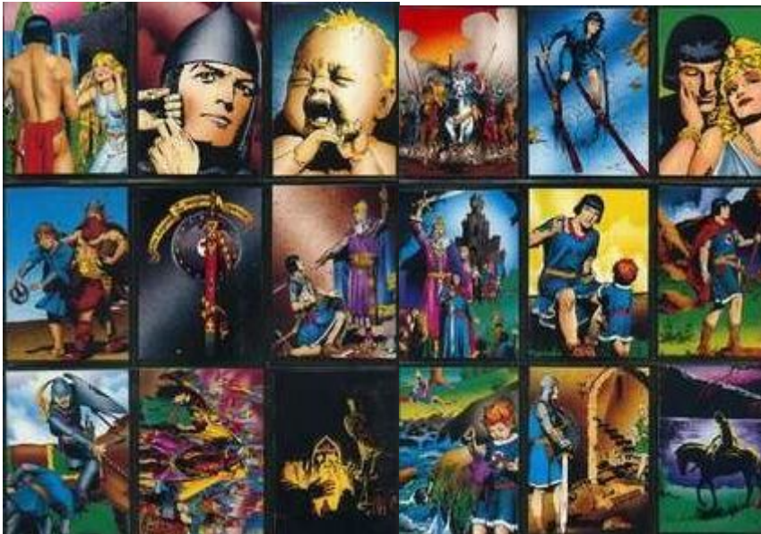
Abb.2: Sammelkarten (Auszug)