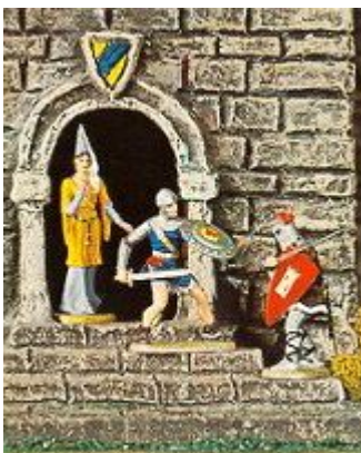
Abb. 6: Prinz Eisenherz verteidigt ein Burgfräulein (aus einem Hauser Elastolin-Katalog)