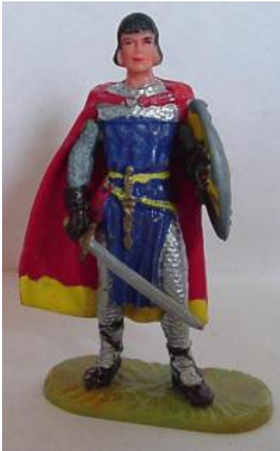
Abb. 4: Prinz Eisenherz in Elastolin